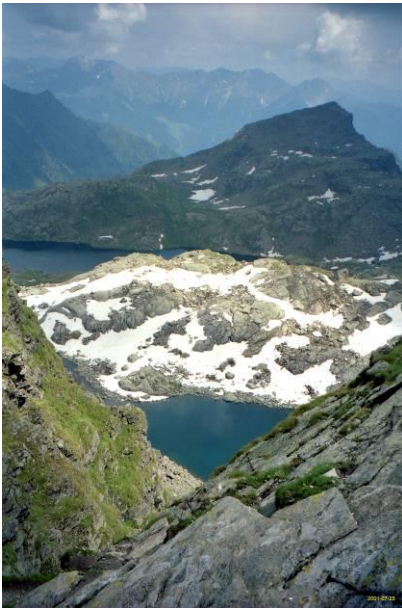
Bild 6: Abstieg von der Milchseescharte zu den Milchseen, dahinter der Langsee