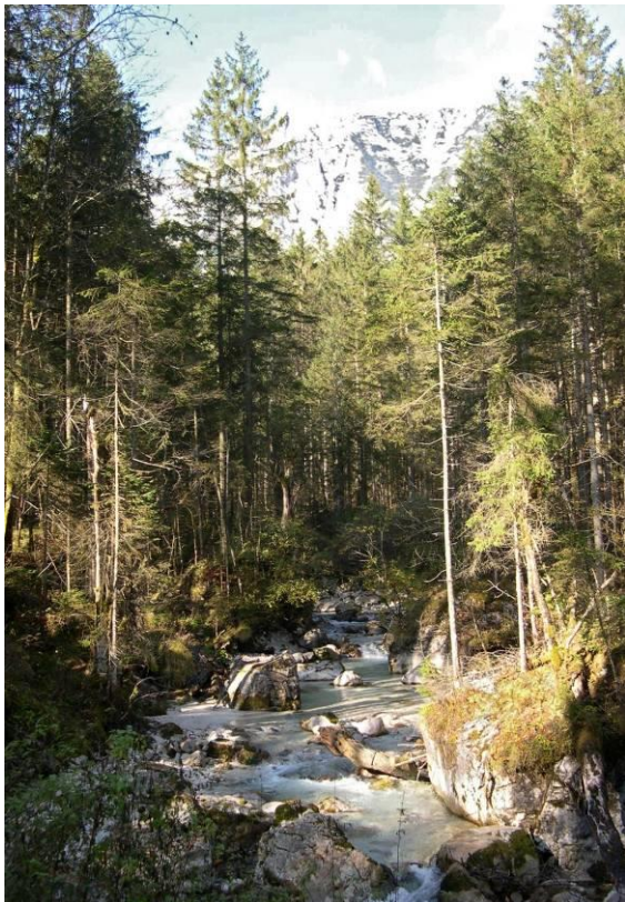
Ramsauer Ache im Zauberwald

Falls bis nach Hirschbichl (Gaststätte) weitergewandert werden soll, ist der Wanderweg 481 im Wald links von der Straße zu empfehlen.