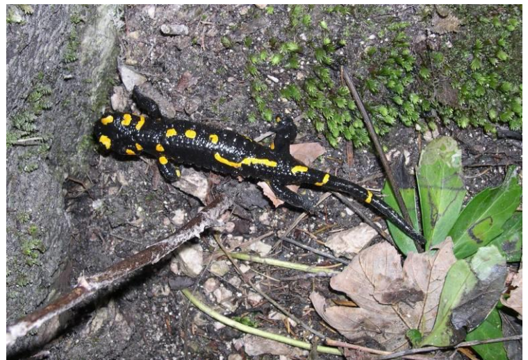
Feuersalamander am Talgrabenweg