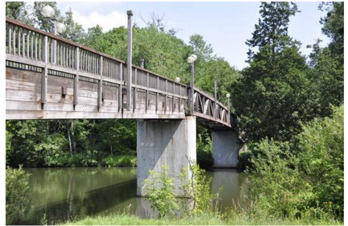
Saalebrücke für Fußgänger und Radfahrer

Für Familien und Genussradler ist besonders Strecke zwischen Weißenfels und Bad Kösen geeignet.