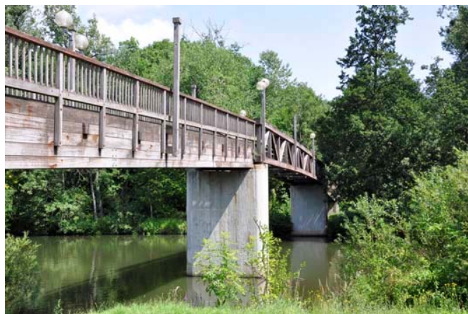
Saalebrücke für Fußgänger und Radfahrer

Für Familien und Genussradler ist besonders Strecke zwischen Weißenfels und Bad Kösen geeignet.