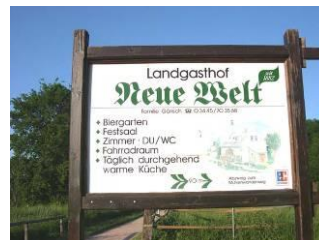
Abzweig Neue Welt