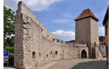
Eckstädter Tor Freyburg