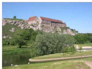
Wendelstein über Unstrut