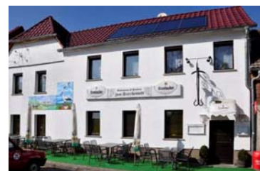
Gaststätte Zum Storchennest