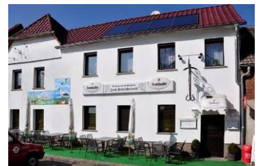
Gaststätte Zum Storchennest