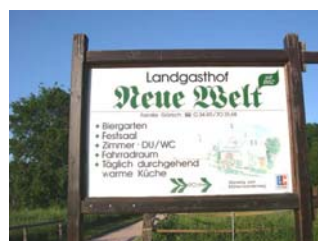
Abzweig Neue Welt