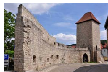
Eckstädter Tor Freyburg