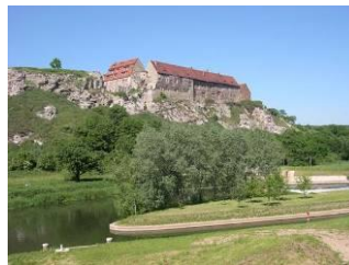
Wendelstein über Unstrut