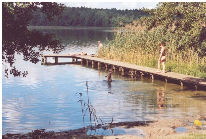
Badesteg am Campingplatz C28 (2008)

Von Rechlin ein kurzes Stück auf der B198 nach Westen, nach 1,3 km links abbiegen. > Neu Gaarz > Lärz . Von Einfahrt Mirow (Mirowdorf) rechts Richtung Schwarz > Starsow > Brücke über Mirower Kanal > Industriegebiet Mirow oder über den in der gpx-Datei enthaltenen Track „Alternativer_Feldweg“ [in bikemap-Datei gem. Punkten] > Peetsch