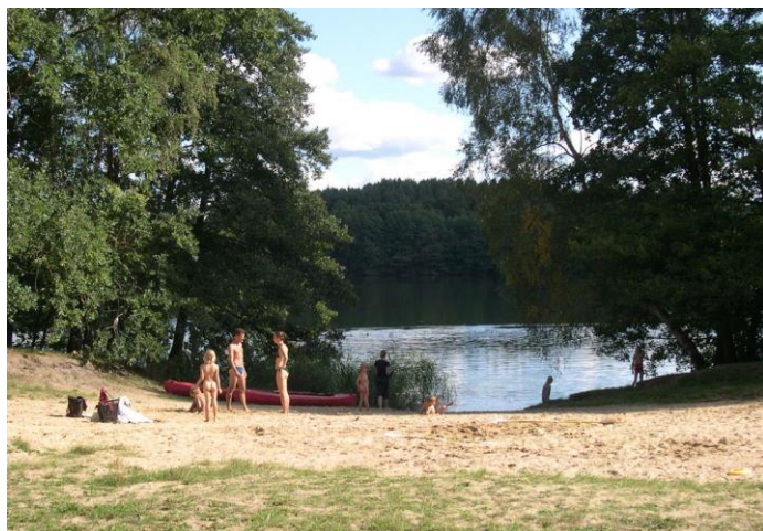
Badestelle am Pagelsee (2008)