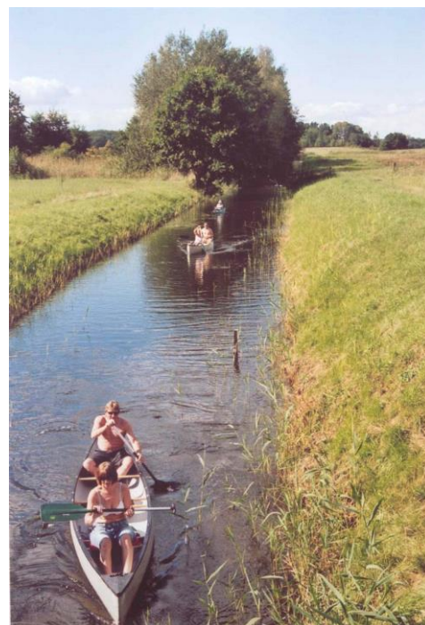
Havel bei Babke (2008)