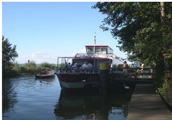
Schiffsanleger Bolter Kanal (2008)