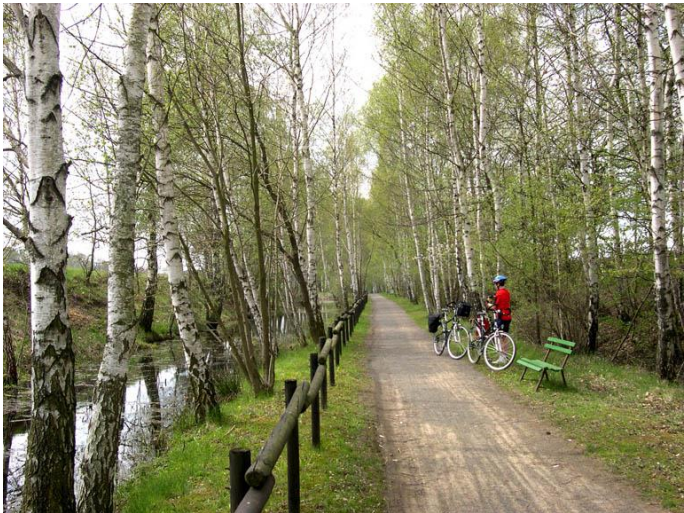
Lehrpfad auf ehemaligem Bahndamm