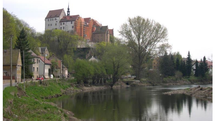
Schloss Colditz über der Zwickauer Mulde