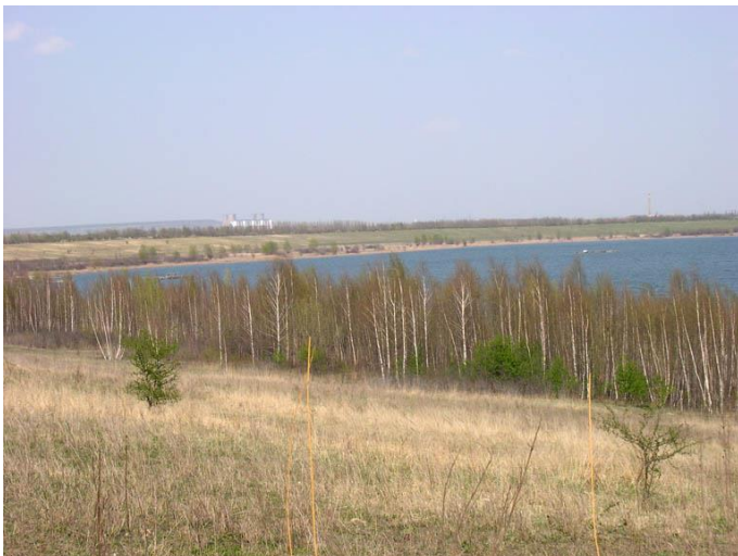
Speicher Borna („Adria“) im April